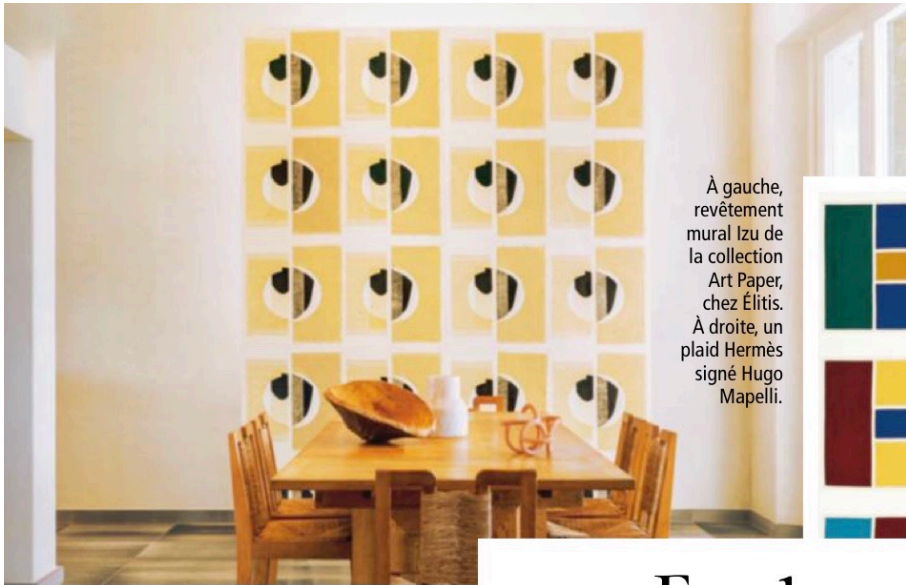
À gauche, revêtement mural Izu de la collection Art Paper, chez Élitis. À droite, un plaid Hermès signé Hugo Mapelli.